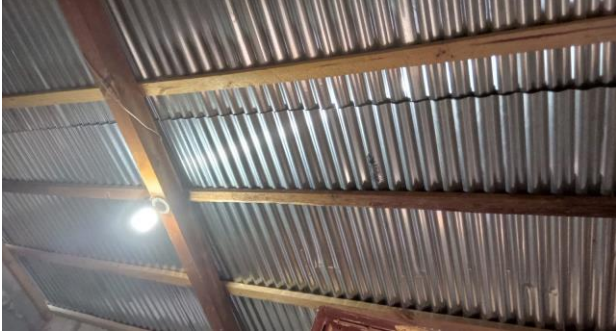
Foto1: reparación de sistema electrico