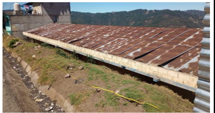
Foto 4: sustitución de lamina, por lámina troquelado aluzinc calibre 26